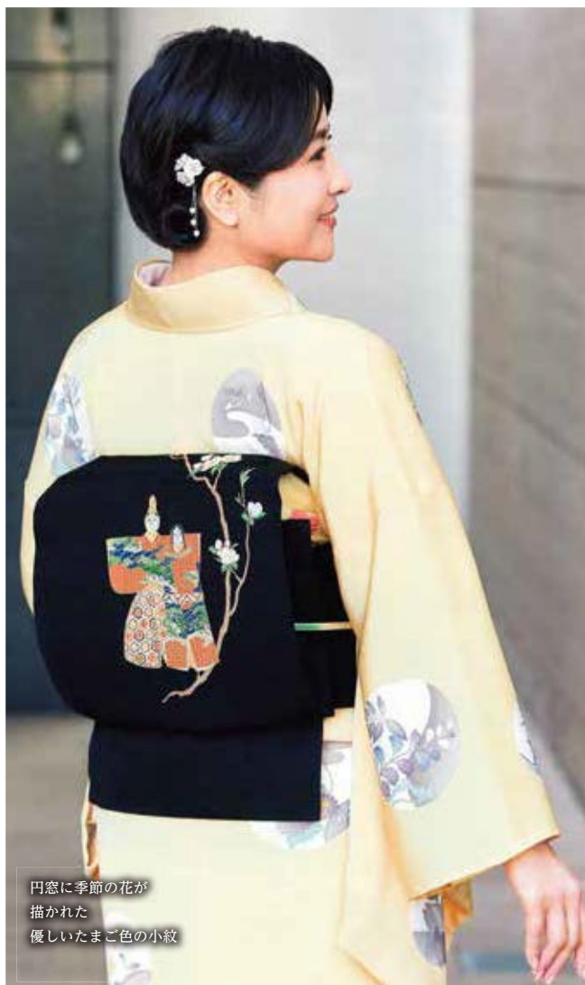
円窓に季節の花が 描かれた 優しいまご色の小紋