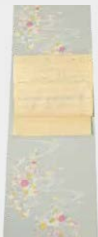
古典絵巻に誘う 御所解文様 レモン色の帯で 爽やかに