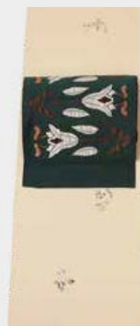
都会的な大人色の 更紗小紋 深い緑の帯で スタイリッシュに