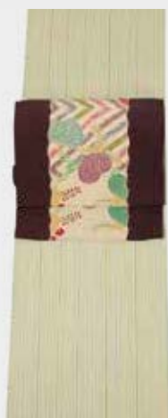
手描きの縞は 粋さも和らぎます 葵の染帯で 浪漫派風に