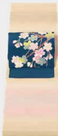
廣瀬草木工芸の 美しい織物に 寺谷昇作「桜」 花の季節を楽しむ装い