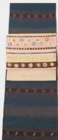
すっきりとした 琉球紬は単衣になさっても 木版更紗の帯で 軽やかに

〒560-0021 豊中市本町4-1-8 TEL 06-6849-5298(代) FAX 06-6852-1021 http://www.orimoto-t.co.jp