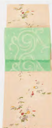
きちんと感のある紹縮緬の小紋はミント色の帯で爽やかさをプラス