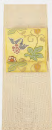
細かい十字餅の小千谷紬は蒸し暑さを忘れさせてくれる シャリ感です レモン色の帯で爽やかに