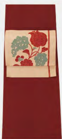
透けない単衣の期間が年々長くなっています 光沢のある深いワイン色の軸にアトリエ品川の染め帯