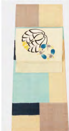
大胆な市松の伊那袖は復刻して織ってもらいました 茗荷と茄子が微笑ましい 湯本エリ子さんの染め帯

柳に沢瀉などの水草を表した古典的な水辺の風景が夏の情景を想起させる組の付け下げ組の透け感がより涼しさを演出します