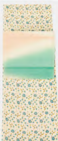
愛らしい水色と黄色の小花文様の夏軸 柔らかくモダンな配色の麻の名古屋帯ではんなりと