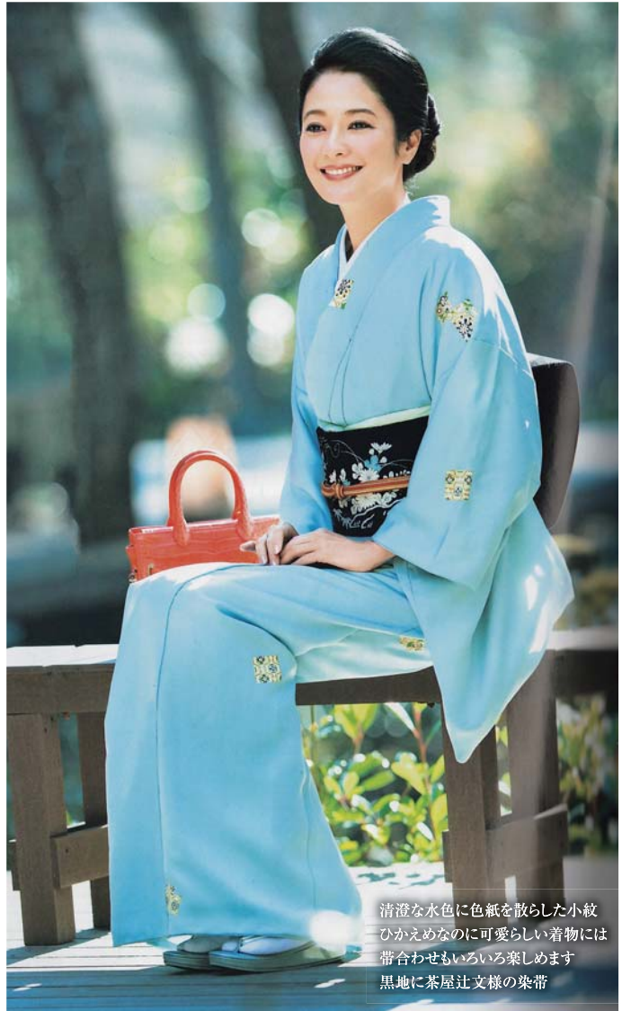
清澄な水色に色紙を散らした小紋 ひかえめなのに可愛い着物には 帯合わせもいろいろ楽しめます 黒地に茶屋辻文様の染帯

〒560-0021 豊中市本町4-1-8 TEL 06-6849-5298(代) FAX 06-6852-1021 http://www.orimoto-t.co.jp