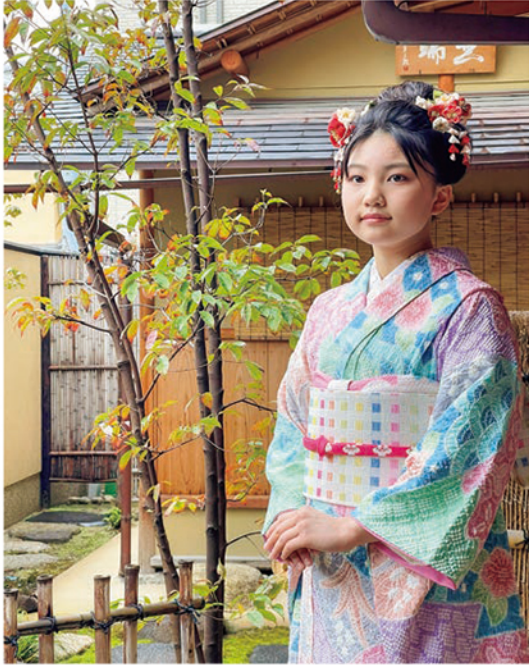
卒業式や大切な節目の行事の時に着せている 子供達のお気に入りのお着物です 今年の十三参りにも着させて頂く予定です