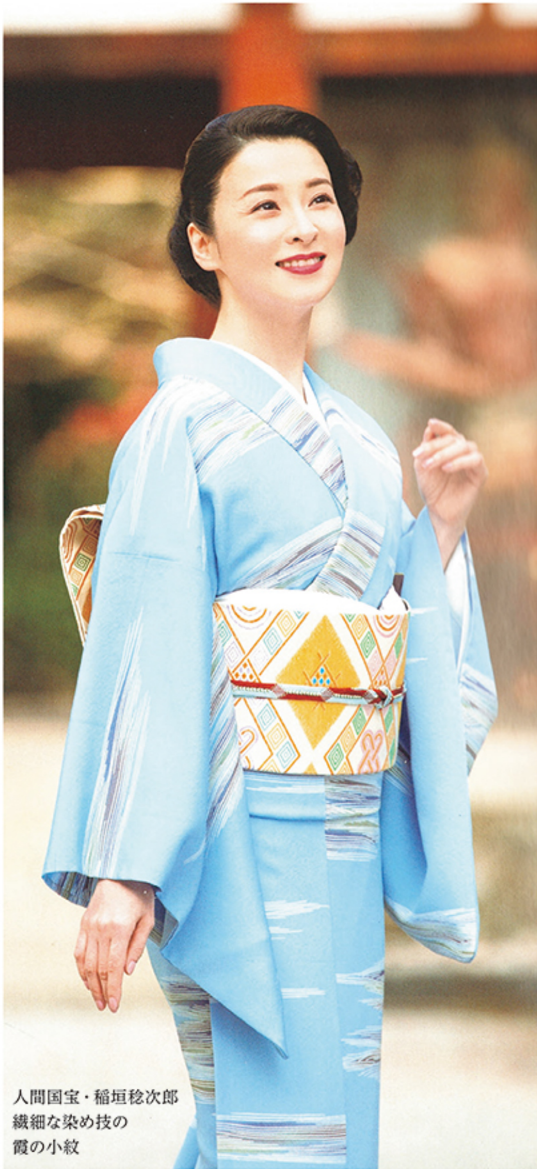
人間国宝・稲垣稔次郎 繊細な染め技の 霞の小紋