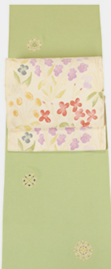
明るい薔色に精巧な オリエント文様を描いたきもの お花畑を思わせる名古屋帯で 華やいだ春気分をまとめて