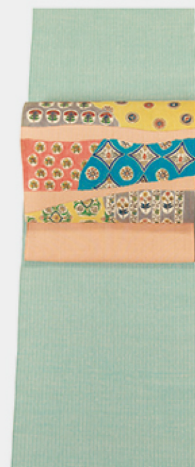
小岩井さんの上田紬は きりっとしてしなやかな地風 爽やかな青磁色にはカラフルな 木版更紗の帯で楽しく