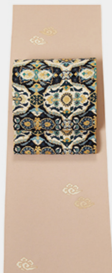
灰桜色に吉祥の雲を 愛らしく描いたきもの エキゾチックな印象の袋帯で さりげなく個性的に