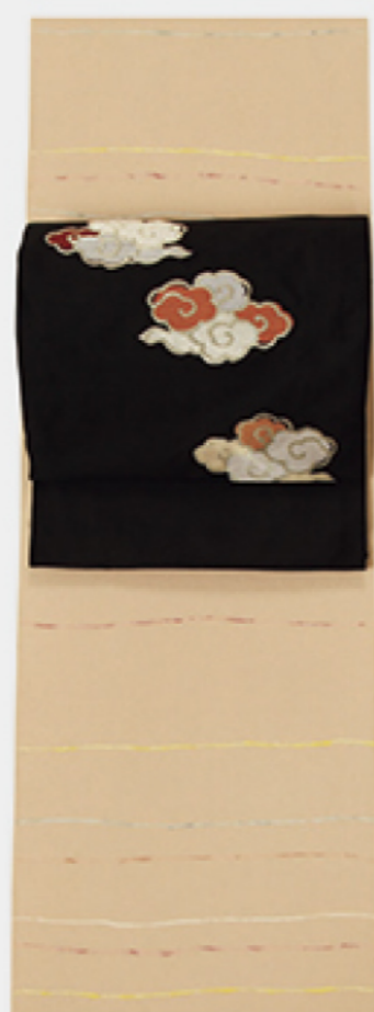
鳥の子色にパウルクレーの絵画のような 明るい色彩をちりばめたきもの 瑞雲を織り描いた帯でクラシカルな 印象にととのえて